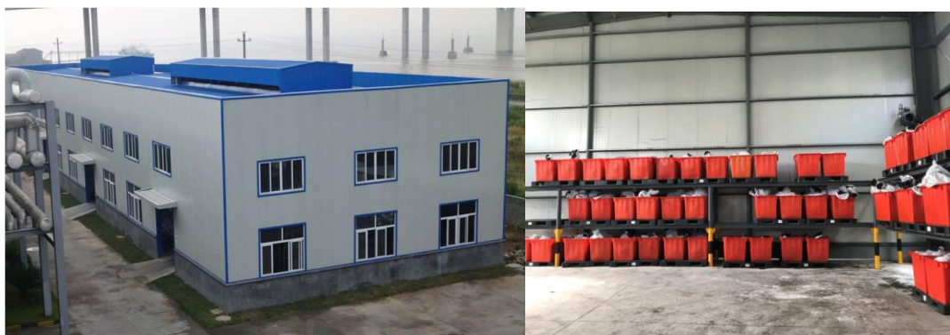
华峰化学公司固体废物处置情况